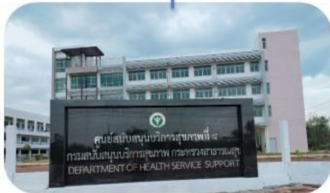
ศูนย์สนับสนุนบริการสุขภาพที่ 8