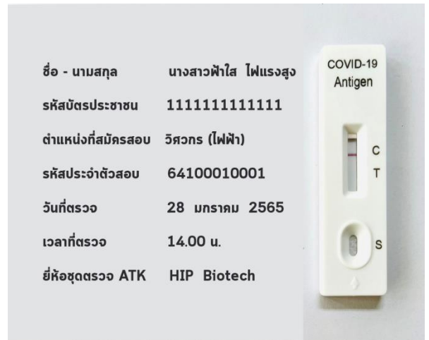
ภาพตัวอย่าง : ผลการตรวจ Antigen Test Kit (ATK)

3.3 ต้องปฏิบัติตามมาตรการและคำสั่งศูนย์บริหารสถานการณ์การแพร่ระบาดของโรคติดเชื้อไวรัสโคโรนา 2019 (COVID - 19)